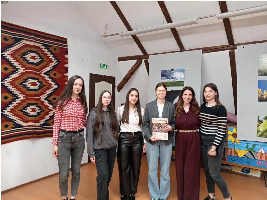
Naziv: Podsticanje kulture učešća u dijalogu za regionalno pomirenje – Distrikt pomirenja